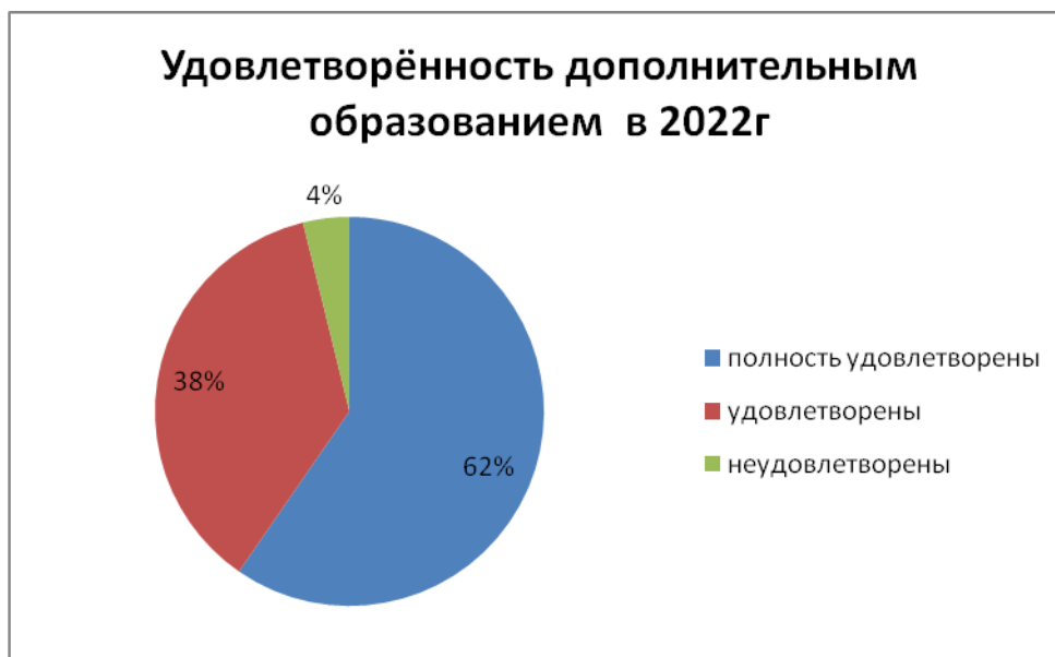
Диаграмма по удовлетворённости родителей дополнительным образованием

Анализ данных по посещению детьми занятий дополнительного образования показывает стабильность. Опрос родителей (законных представителей) обучающихся в сентябре 2022 года показал, что большая часть опрошенных в целом удовлетворены качеством дополнительного образования в Школе.